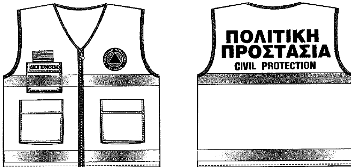
Εικόνα 2. Επιχειρησιακά γιλέκα Πολιτικής Προστασίας

Αναλυτικές προδιαγραφές για την εμφάνιση των επιχειρησιακών μπουφάν και γιλέκων Πολιτικής Προστασίας δίνονται στο 4678/22-11-2004 έγγραφο ΓΓΠΠ.