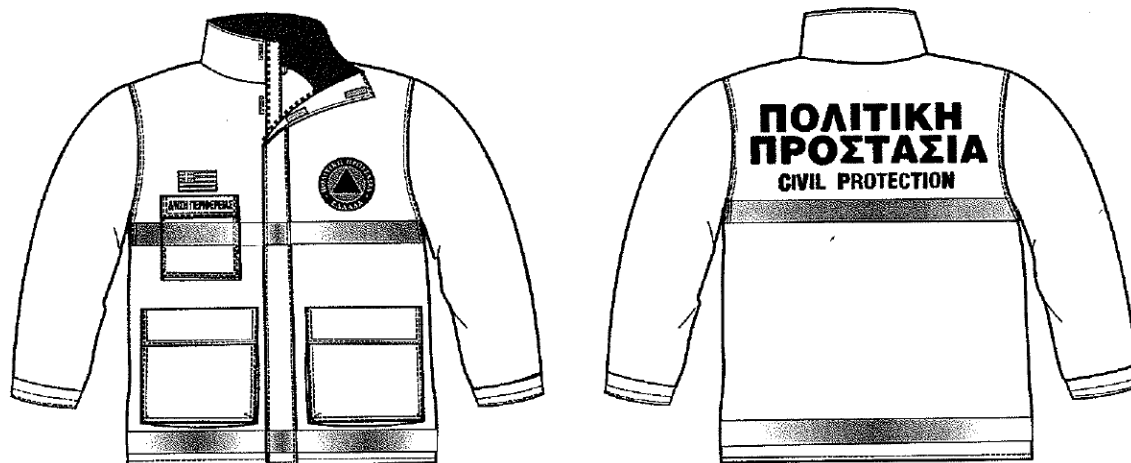
Εικόνα 1. Επιχειρησιακά μπουφάν Πολιτικής Προστασίας

Σύμφωνα με το 4678/22-11-2004 έγγραφο ΓΓΠΠ, τα επιχειρησιακά μπουφάν Πολιτικής Προστασίας θα πρέπει να έχουν την ακόλουθη μορφή: